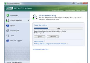
Screenshots ESET NOD32 Antivirus

Folgendes Bildmaterial ist in Druckauflösung bei der PR-Agentur Hochegger|Com erhältlich: