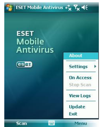
Screenshots ESET Mobile Antivirus

Folgendes Bildmaterial ist in Druckauflösung bei der PR-Agentur Hochegger|Com erhältlich: